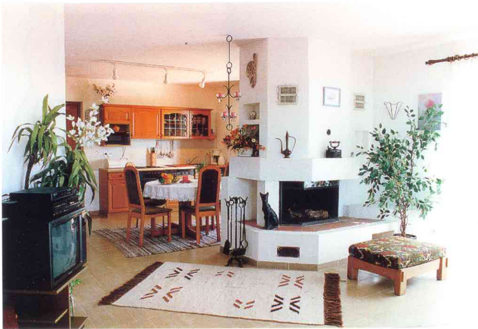
Wohnzimmer, mit Blick in die Küche • Wohnung Unten

Wohnung Unten: 95 m 2 2 Schlafzimmer 1 Wohnzimmer 1 EBküche geräumiges Bad mit Dusche Abstellraum Offener Kamin SAT-TV Waschmaschine Terrasse (45 m 2 ), teilweise überdacht Offener Kamin (zum Grillen geeignet) Meer- und Bergpanorama